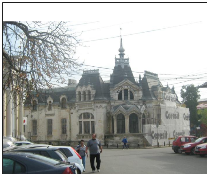
Casa Luca Elefterescu - Muzeul Ceasului Nicolae Simache